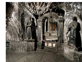
Wieliczka Salt Mine Wieliczka-Kopalnia