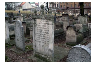
Jewish District Żydowskie Zabytki Kazimierza

WYCIECZKI z zawodowymi przewodnikami dla szachistów i osób towarzyszących http://www.przewodnik-krakow.pl/