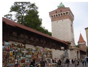
Cracow - Old Town Stare Miasto

EXCURSIONS with professional guides for chessplayers and accompanying persons http://www.guide-cracow.pl/