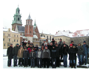
Royal Wawel Hill Wzgórze Wawelskie

WYCIECZKI z zawodowymi przewodnikami dla szachistów i osób towarzyszących http://www.przewodnik-krakow.pl/